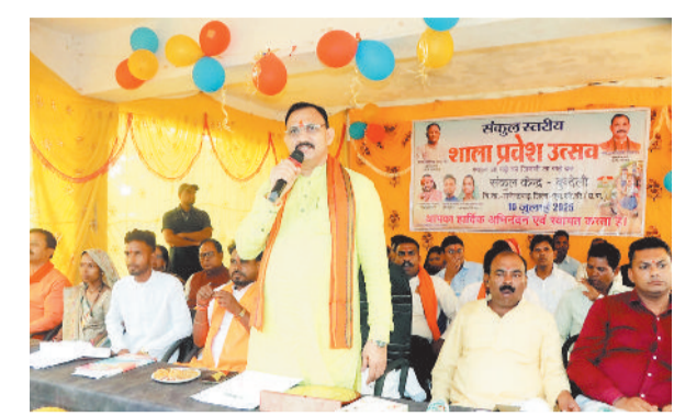
गुरु पूर्णिमा के अवसर पर गुरुजन्म सम्मान