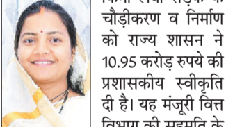
किमी लंबी सड़क के चौड़ीकरण व निर्माण को राज्य शासन ने 10.95 करोड़ रुपये की प्रशासकीय स्वीकृति दी है। यह मंजूरी वित्त विभाग की सहमति के बाद जारी हुई है। यह सड़क परियोजना आवागमन को सुगम बनाने के साथ