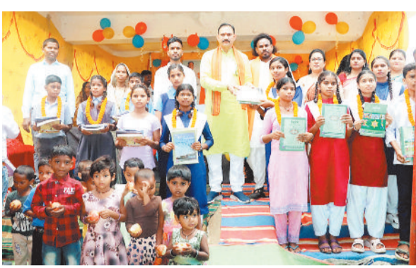
वनाधिकार पट्टा का किया वितरण