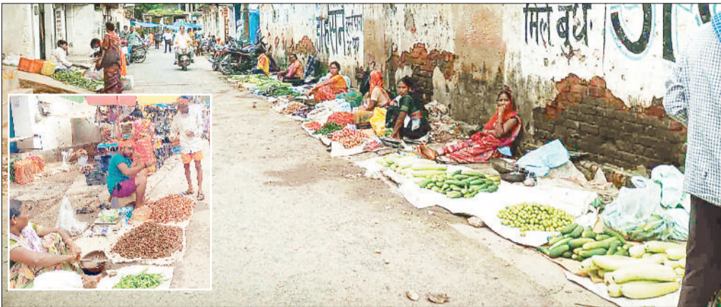
गुदरी बाजार में सब्जी बेचते ग्रामीण, इनसेट में पुटू बेचते व्यापारी।

बरसात के मौसम में हर साल सब्जियों की कीमत में उछाल आता है लेकिन लम्बे अरसे बाद इस बार जून में ही कीमतें आसमान पर पहुंच गईं। आलू, प्याज की कीमतें यथावत हैं जबकि अन्य सब्जियों के दामों में चारगुना से अधिक की वृद्धि हो गई है। कीमतों में अप्रत्याशित वृद्धि होने के कारण सब्जियां सामान्य लोगों की पहुंच से दूर हो गई हैं वहीं मध्यम वर्गीय परिवार के बजट को बिगाड़ रही है। यह भी सच है कि सब्जी उत्पादन के क्षेत्र में सरगुजा के किसान प्रदेश स्तर पर लगातार अपनी पहचान बना रहे हैं। सब्जी उत्पादन के रकबे में भी लगातार वृद्धि हो रही है इसके बावजूद बरसात में मांग के अनुरूप सब्जियों का उत्पादन नहीं हो रहा है। पूर्व में बरसात के समय सरगुजा में टमाटर का उत्पादन नहीं होता था लेकिन उत्पादक किसानों ने अपनी मेहनत से ब बड़े पैमाने पर बरसात में टमाटरका उत्पादन कर अच्छी कमाई कर रहे हैं। अन्य सब्जियों का भी उत्पादन बड़े पैमाने पर किया जा रहा है लेकिन किसानों को अभी तक लगातार बारिश से फसलों को बचाने का उपाय नहीं मिल पाया है।